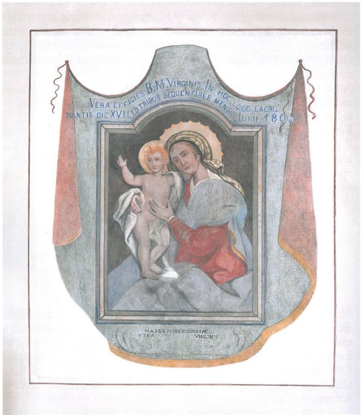
Mater Misericordiae (Canonica della Basilica di Gonzaga)